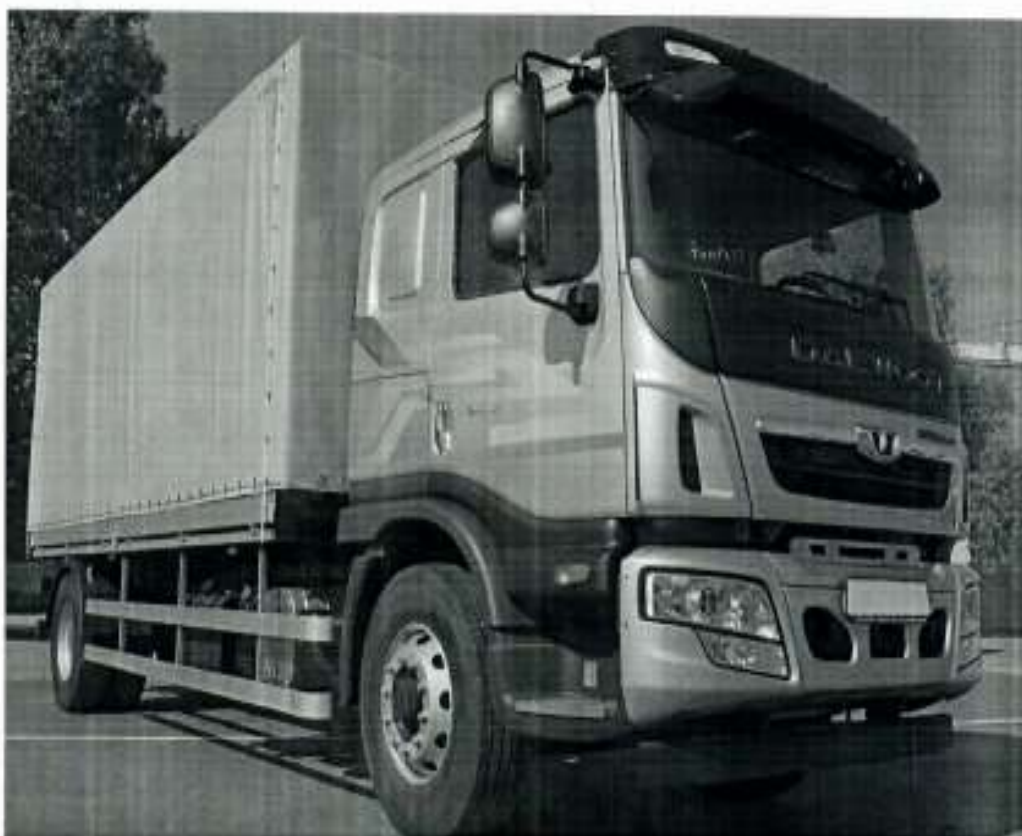
Характеристики базового шасі DAEWOO HC3AA