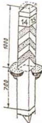
220-260 стовп дерев'яний