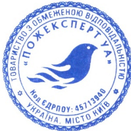
Поліщук Людмила Володимирівна

Всього: 361 400,00 У тому числі ПДВ: 60 233,33